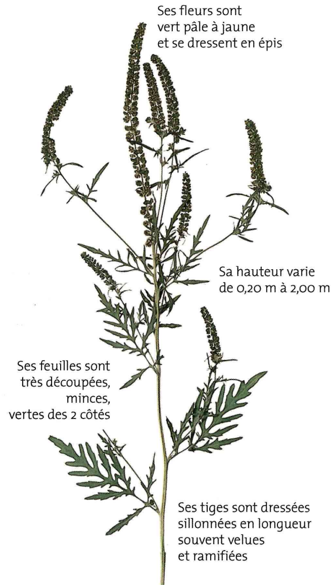
AMBROISIE EN FLEUR