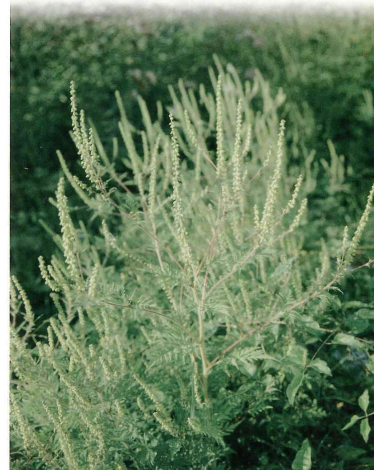
AMBROSIE A FEUILLES D'ARMOISE