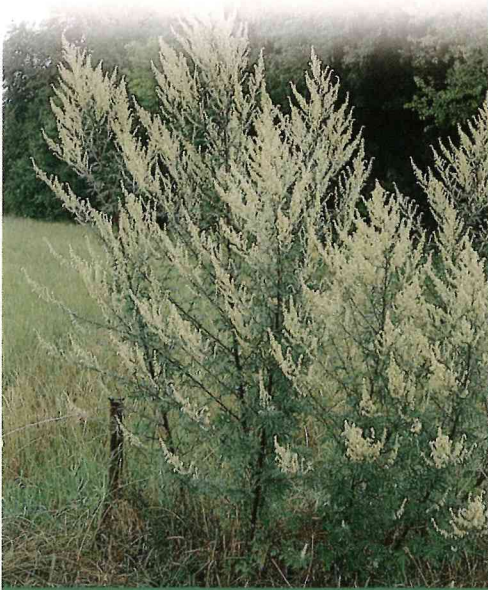
ARMOISE VULGAIRE EN FLEUR

Observatoire des ambrosies, d'après DDAS Rhône