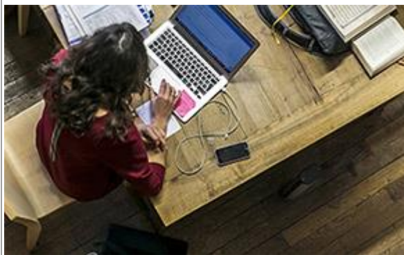
Aides exceptionnelles pour les étudiants

Les bons gestes pour se protéger les uns les autres