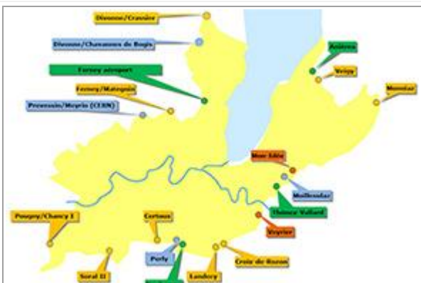
Conditions de passage en France depuis le territoire suisse

La cellule locale d'accès à l'isolement (CLAI) a été mise en place le 18 mai.