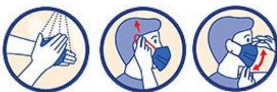
Le port d'un masque