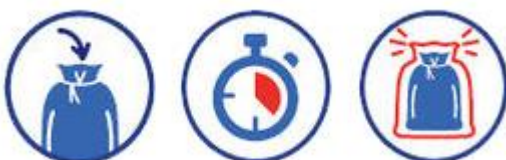
Jeter soigneusement ses masques, gants, mouchoirs et lingettes