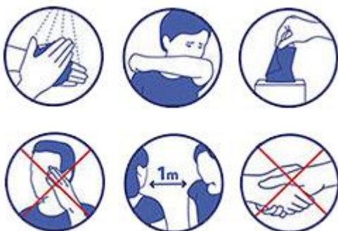
Les gestes barrières

Les bons gestes pour se protéger les uns les autres